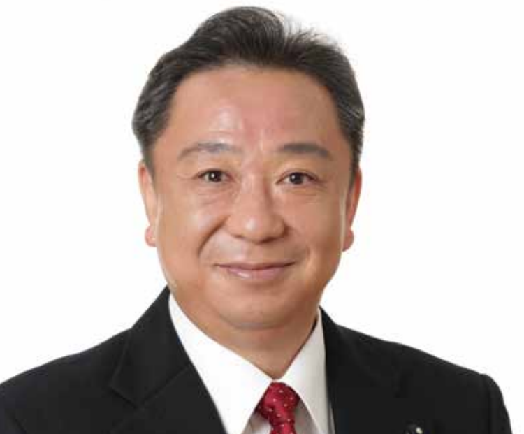
埼玉県議会議員 いしわたり豊

1955年（昭和30年）生まれ。59歳 2003年（平成15年）4月、 埼玉県議会議員に初挑戦・初当選。現在3期